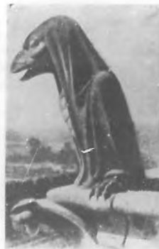
Ave de mal agüero.

Alejandro III colocó la primera piedra, celebrándose la misma inaugural por el patriarca Heracles. Pudiendo decir con pena que este espléndido y antiguo edificio ha sido perseguido por muchos peligros, y ha presenciado un sin número de escenas extrañas y excitantes.