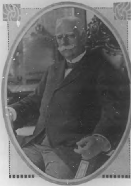
Honorable Gobernador de la Habana Doctor Pedro Bustillo.

tudes; este buen amigo ha sido nombrado vice cónsul mejor cierto ni nombramiento de más justicia. A