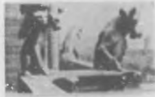
Pasiones viles en admirables gárgolas.

sino un humilde ingenio, un sencillo conducto para arrojar las aguas del techo, derivando su nombre del Latin gurgulio , que significa manga o bomba marina. Al principio no era sino una abertura (o brecha) en la bardana para llevarse el agua de la lluvia. Después un pensamiento feliz brotó de alguna mente inventiva y fue la de añadirle un borde de piedra para que el agua saliese por él del edificio y así evitar el deterioro consiguiente de