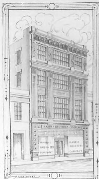
LA CASA DE HARRIS BROTHERS COMPANY. Fachadas del edificio por las calles de O'Reilly y Monserrate.

Como anteriormente, el establecimiento tendrá mayor