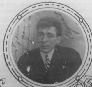
Poeta Agustín Acosta, que ha obtenido mayoría de votos en el concurso de "La Noche".

BOHEMIA felicita al querido colega por el éxito del concurso y estima y agradece la distinción con que la ha tratado, estimulándola y alentándola con sus generosas efusiones.