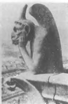
El Diabolo de "Notre Dame".

Durante el reinado del terror, en 1793, se efectuó un orgullo demagógico en los presencios interiores de la catedral, siendo necesario cerrarla al público en 1794, como lugar de adoración divina, pero se volvió a abrir en 1802 por Napoleón. El interior ha sufrido graves desperfectos en manos individuales y del populacho, de tiempo en tiempo. El peor ofensor, probablemente, fue Luis XIV, quien cumpliendo con la promesa de su padre, fue causa de la destrucción de los sitialos de oro del siglo catorce, los altares mayores embellecidos con sus estatuas de oro y plata, los claustros, tumbas y sus vasos, cristales y corales. En 1845, fue necesario res-