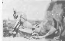
Monstruo med o felino y medio canino con cabeza de diablo.