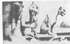
La envidia y la ira viviendo en estos monstruos.

El grupo reproducido arriba—Núm. 5—contiene una gárgola comparativamente agradable en la forma de un toro contemporáneo, cuya carencia de