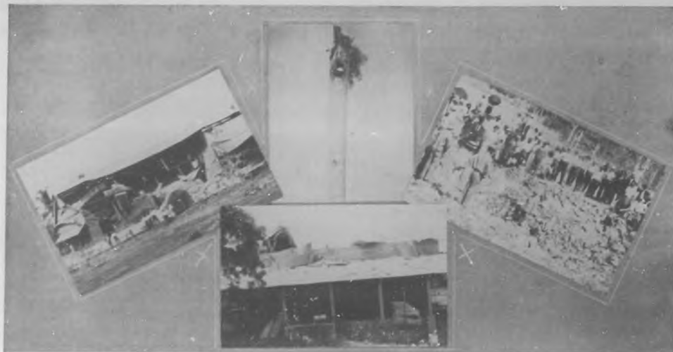
SINIESTRO EN PANAMA. — Estado en que quedó una palma distante 60 metros del polvorín. — Solar del polvorín. — Estado de una fábrica de mantequilla y jabón a 50 metros de el polvorín. — Otro aspecto de las ruinas de la fábrica.

Brothers. Hace unos ocho años los Harris Brothers y Jacob Lycheheim, unificaron sus casas y formaron la que es actualmente conocida por la "Harris Brothers Company".