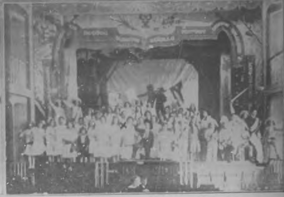
DE GABARIEN. — Fiesta celebrada por la "Cubania Española." — Escena cómica muy sugestiva de la preciosa obra "Fechas Cubanas." — Otra interesante escena de la obra, en que toman parte preciosas niñas. — Escena patriótica muy llamativa. — Españole apoteosis.

por los muchachos de las escuelas, fue puramente patriótica, de esos que dejan en el alma recuerdos imperiosos.