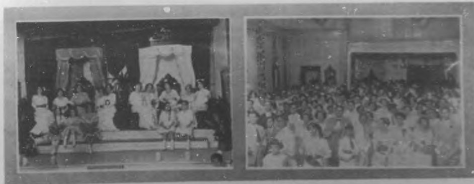
DE REGLA.—La Reina y Damas de honor de los bandos "Blanco" y "Verde" de la sociedad "Progreso Reglano" en sus respectivos tronos. Aspecto de la concurrencia en el acto de la proclamación de las Reinas de los Bandos "Blanco" y "Verde" de la sociedad el "Progreso Reglano".

La compañía giró al principio bajo el nombre de Harris