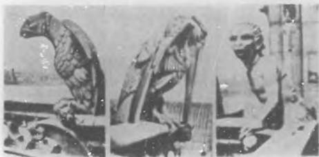
Ave de rapiña, que en su feroz expresión expresa pasiones enfermizas.

Nuestra última gárgola es una recordación de un lugar en esta galería de brambas de piedra. El escultor ha dado aquí a su imaginación la licencia más alta y ha producido un monstruo terrible; parte hombre y parte diablo; siendo todos sus aspectos los de un demonio. Su semblante, repulsivo, es lo suficiente